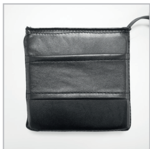
Lado norte del solenoide

Los SOLENOIDES SOFT son una pareja de solenoides formados cada uno por una bobina insertada en una almohadilla blanda. La almohadilla tiene una parte lisa (la que entra en contacto con la piel) donde está el sur del solenoide (letra S ). El Norte, al contrario, corresponde al lado de la almohadilla donde está la abertura. Para fijar el solenoide al cuerpo, inserta la banda elástica debajo de la ranura, luego cierra la banda sobre sí misma para mantener el solenoide bien fijado.