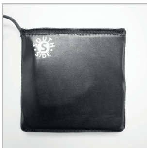
Lado sur del solenoide